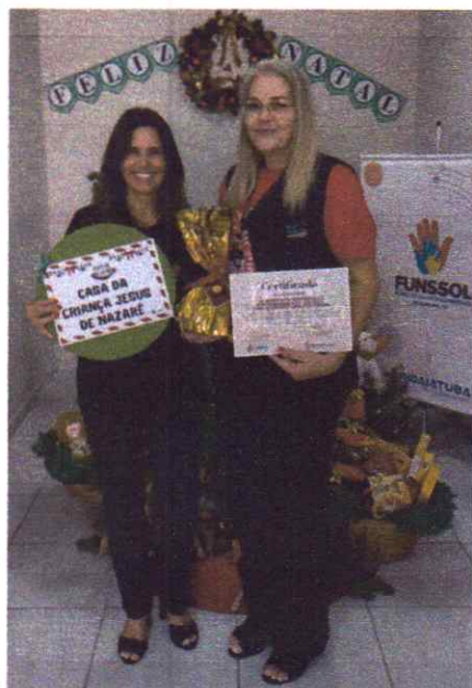
16/12/2025 entrega das cestas